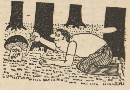
Rys. M. Kanla